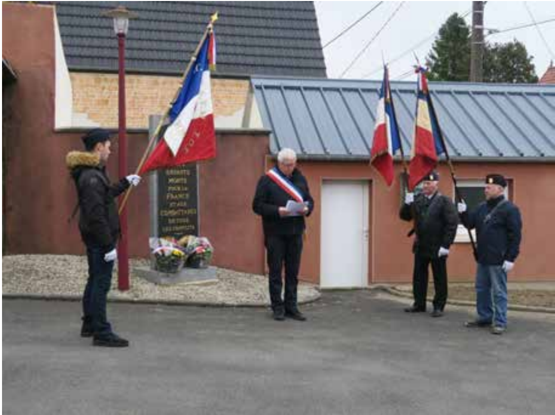
8 mai 2024. Lecture du discours officiel, en présence des porte-drapeaux.