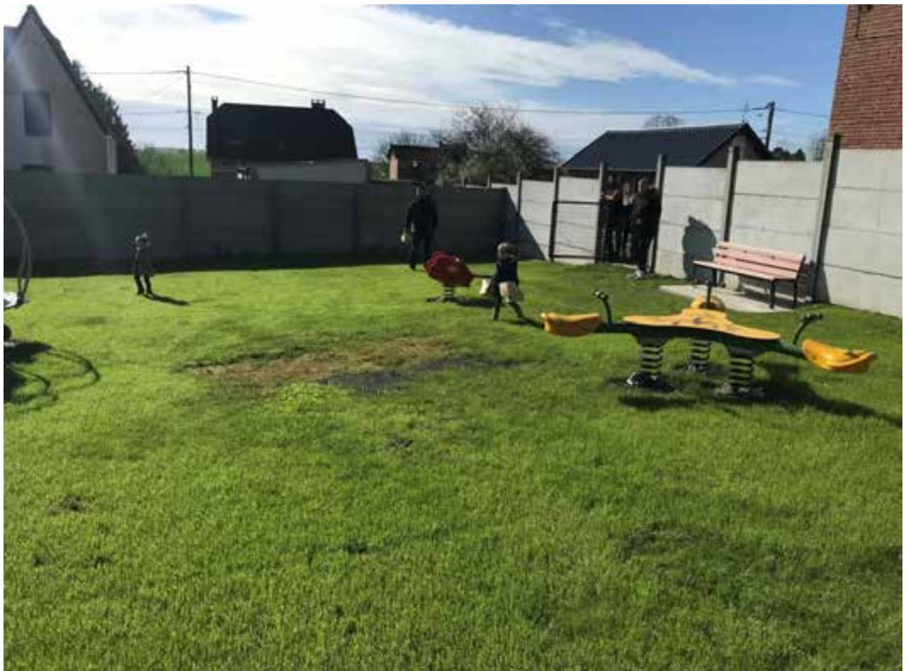
30 mars 2024. C'est toujours agréable de les voir courir pour trouver les chocolats de Pâques laissés à leur intention.