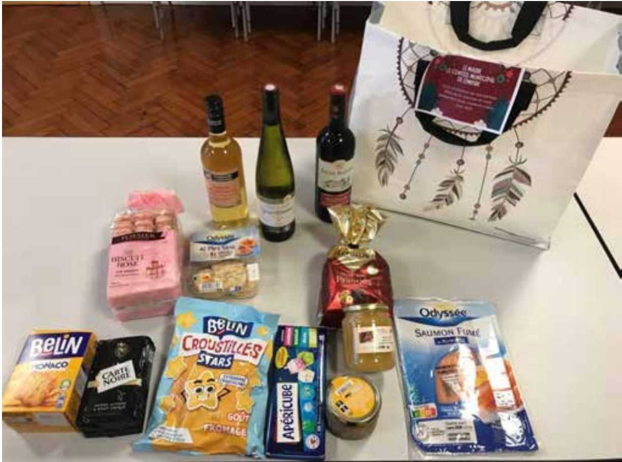
22 décembre 2023, distribution à domicile des colis de Noël aux aînés.