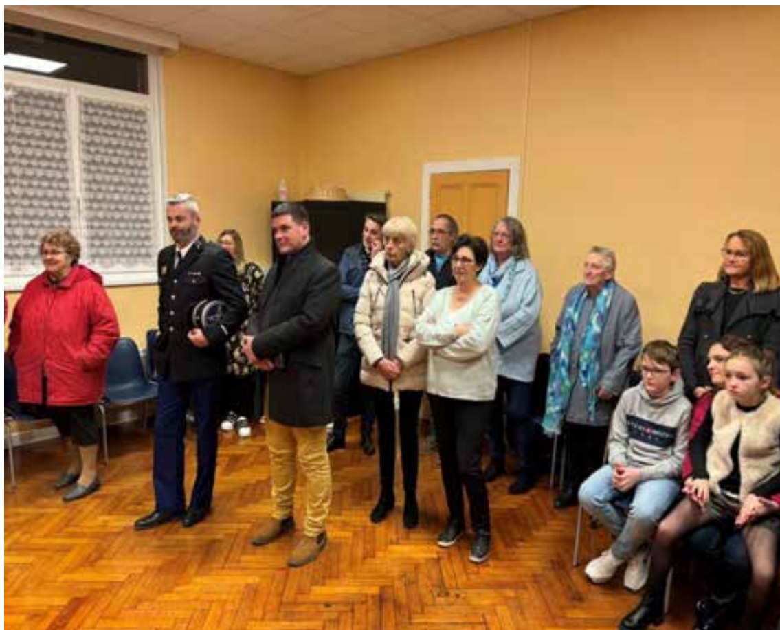
14 janvier 2024. Un public attentif.