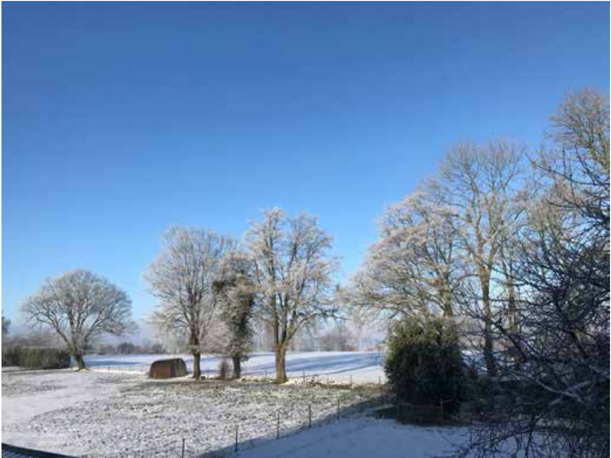
18 janvier 2024. Des paysages de moins en moins courants