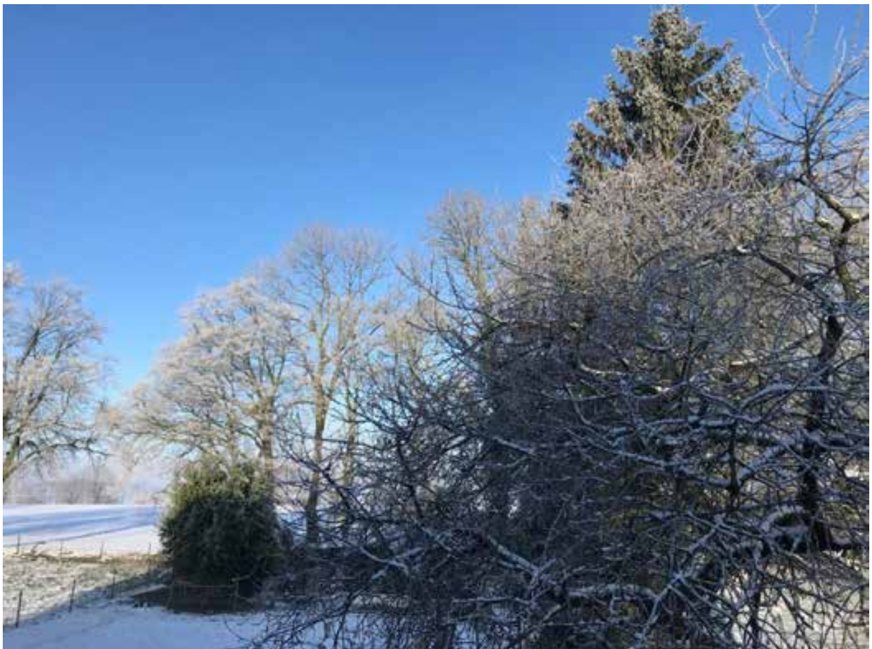
18 janvier 2024. Tout nous ramène au calme et la quiétude du monde rural !