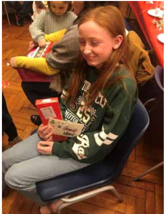
Des enfants régulièrement présents.