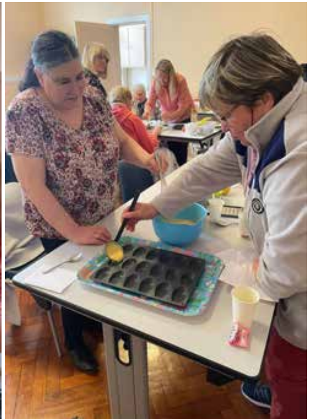
22 mai 2024. Des animations et ateliers fort estimés par les bénéficiaires. Merci pour eux. La salle est mise à disposition gratuitement pour ce genre d'évènement.