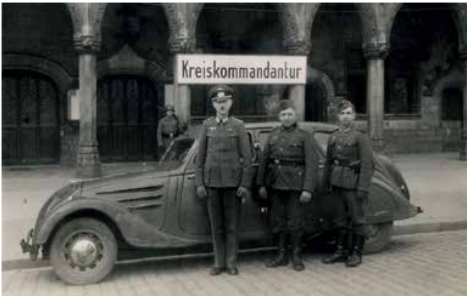
Soldats allemands posant devant l'Hôtel de ville de Saint-Quentin