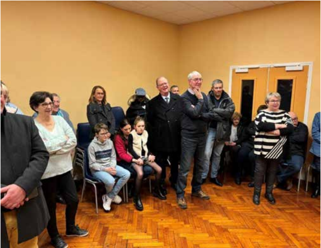
14 janvier 2024. Sans doute une touche d'humour dans le discours du Maire.