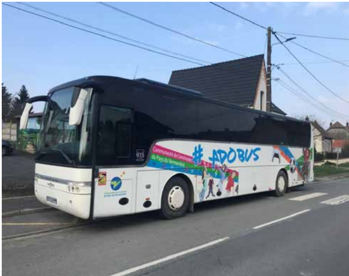
7 mars 2024. Passage de l'Adobus.

Pour la troisième fois, en moins d'un an, l'Adobus, Foyer Rural itinérant, créé à destination des jeunes du territoire âgés de 11 à 17 ans, est de passage dans notre commune à la demande du Maire, par ailleurs Vice-président à la communauté de communes en charge de la petite enfance, l'enfance et la jeunesse.