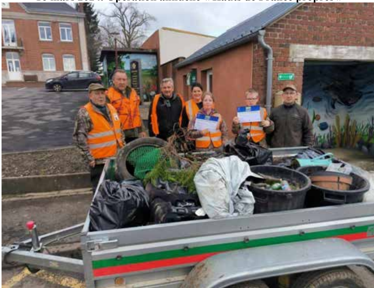
16 mars 2024. Un nettoyage de la nature malheureusement toujours indispensable ! Une remise de diplômes a été réalisée à destination des enfants présents.