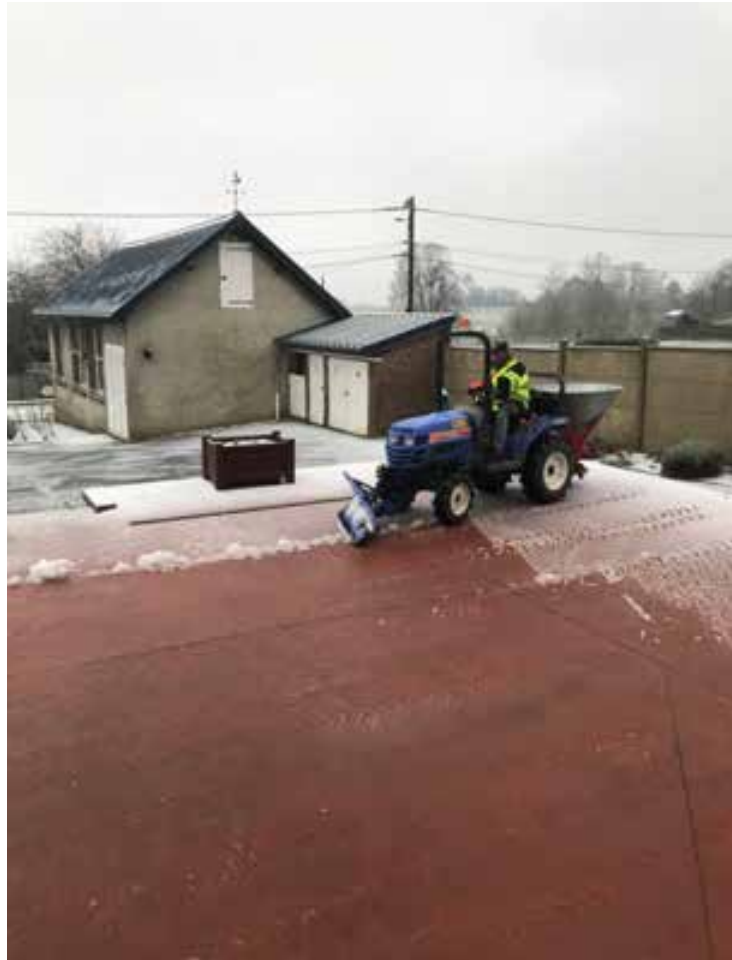
17 janvier 2024. Début des chutes de neige.