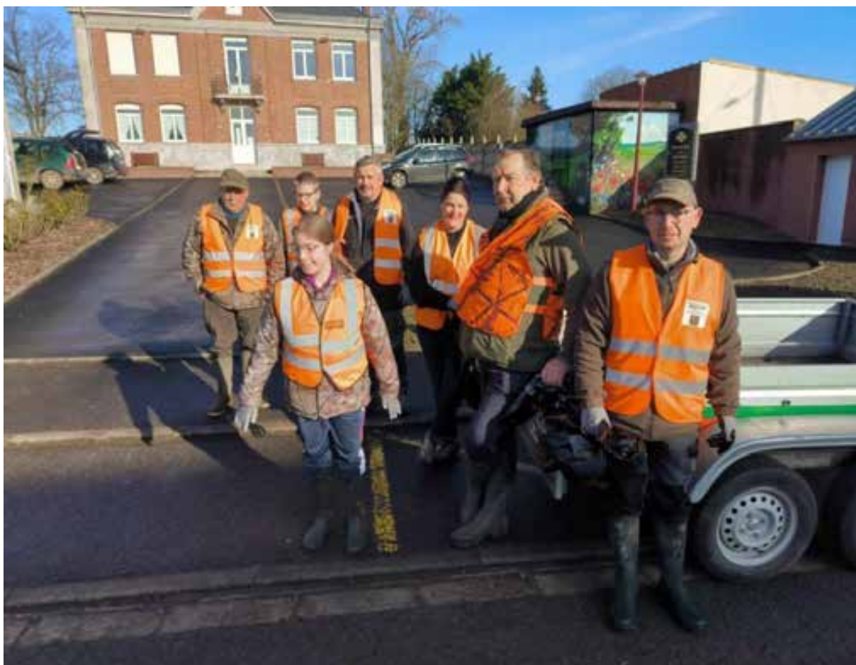
16 mars 2024. Opération annuelle « Hauts de France propres »