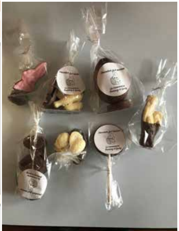
30 mars 2024. Une chasse aux œufs programmée dans les jardins de la Mairie.