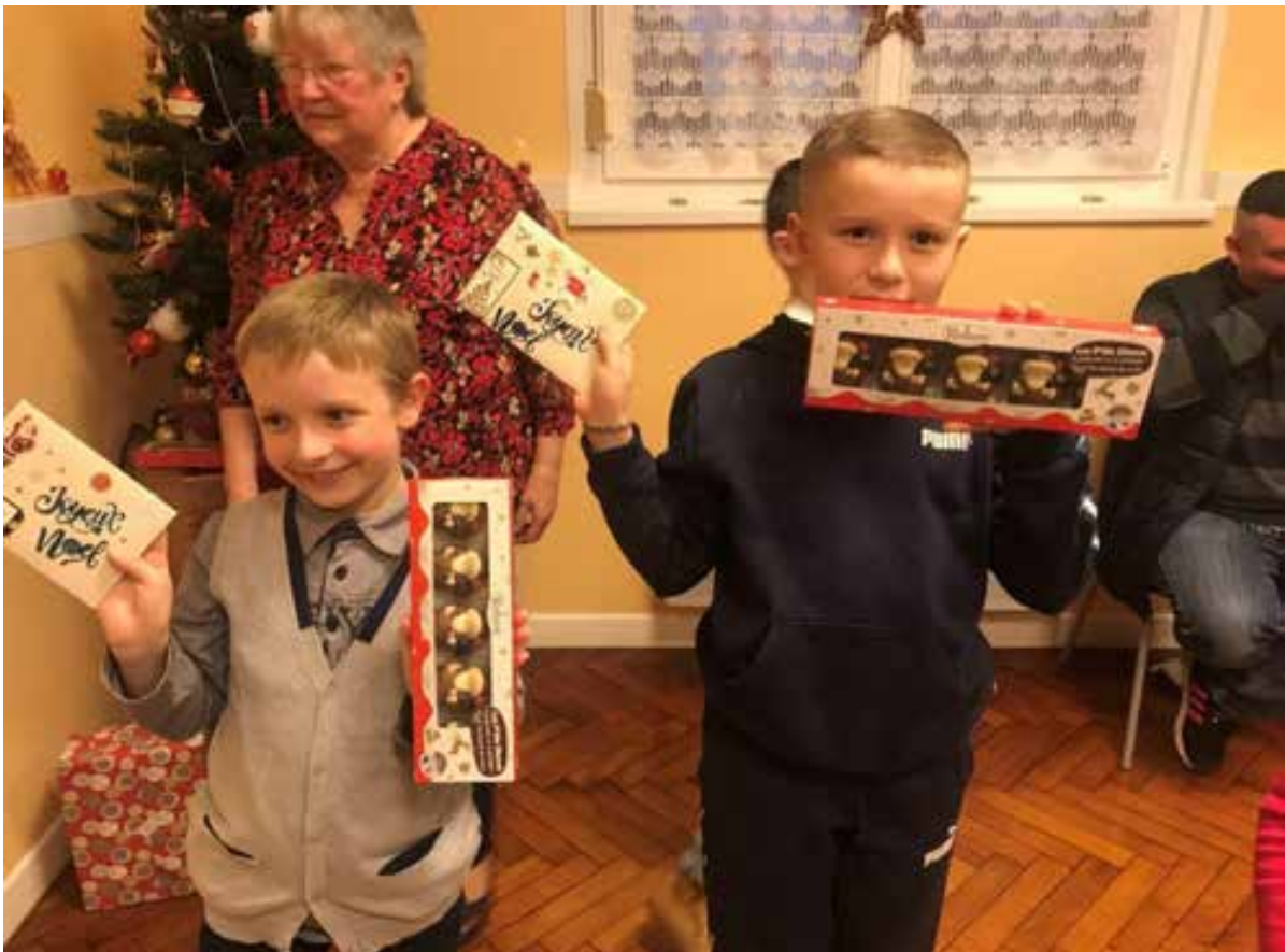
C'est toujours agréable pour nous de constater un taux de présence important.