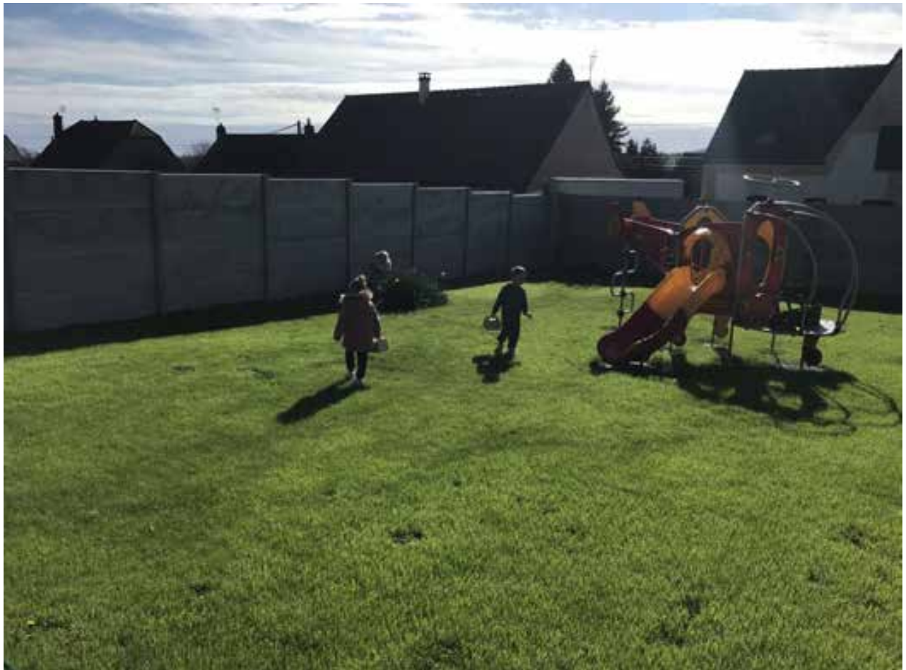
30 mars 2024. Des enfants heureux.