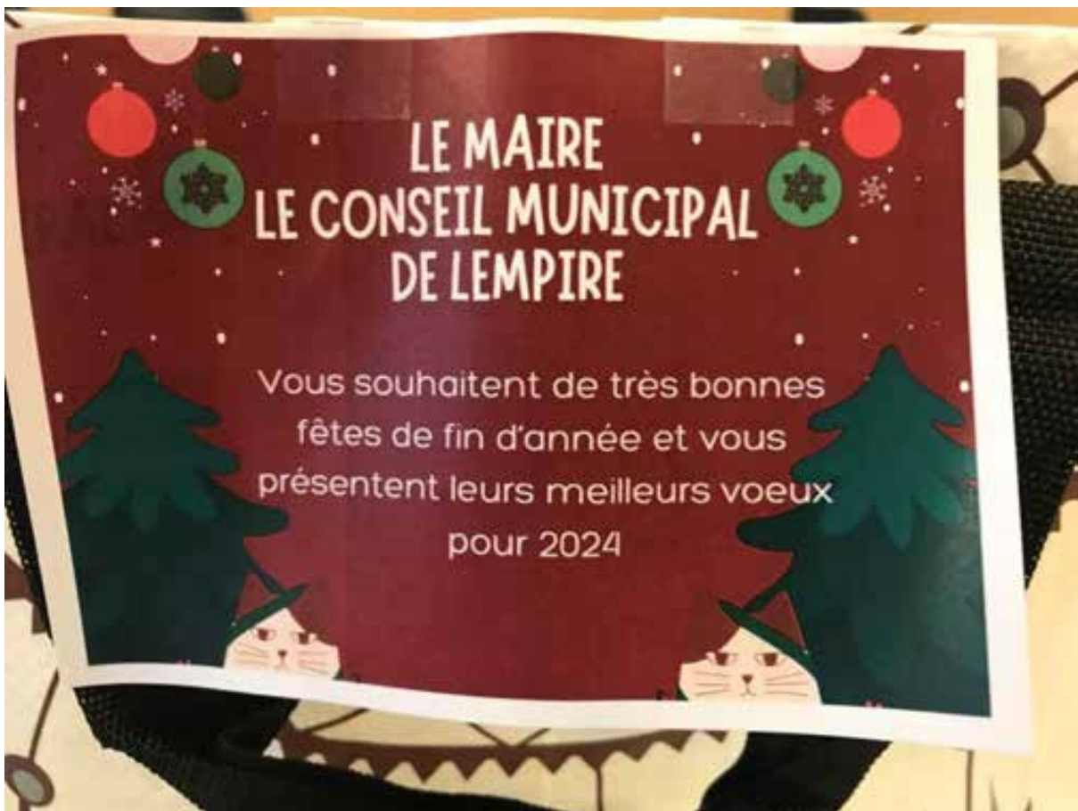
30 bénéficiaires d'un colis conséquent, et d'une carte de vœux du conseil municipal.