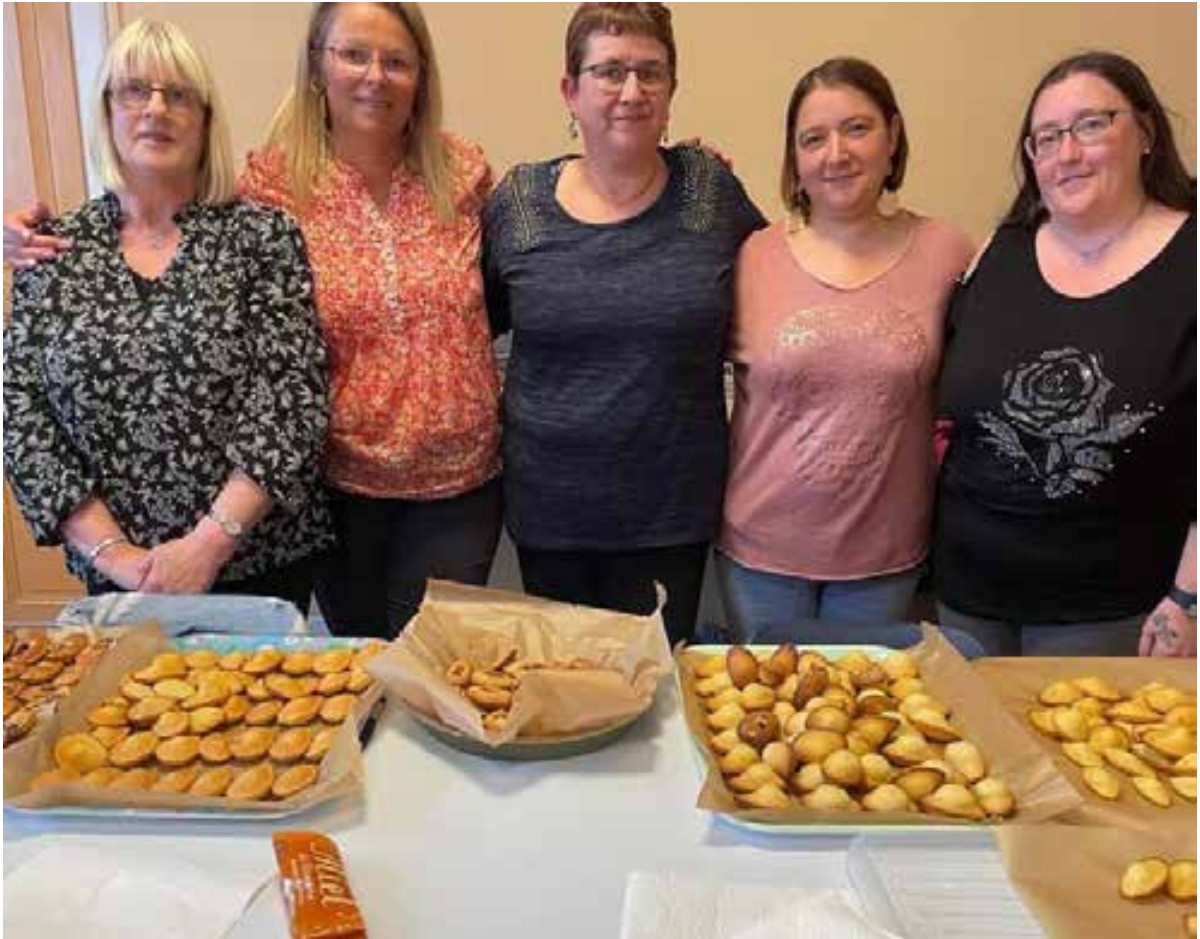
22 mai 2024. Dernière animation du semestre, organisée par le Sivom et son équipe. Cette fois, atelier confection de madeleines !!