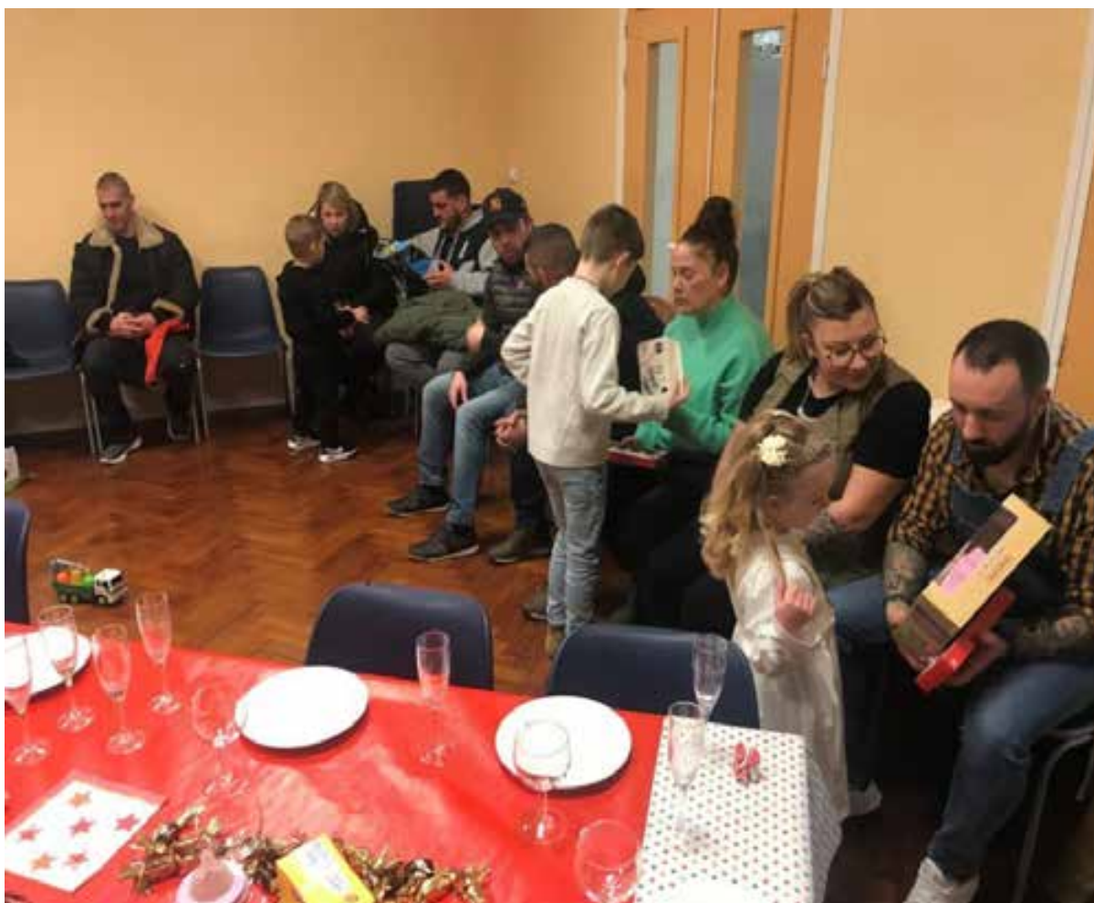
La distribution des cadeaux avait été précédée par un goûter.