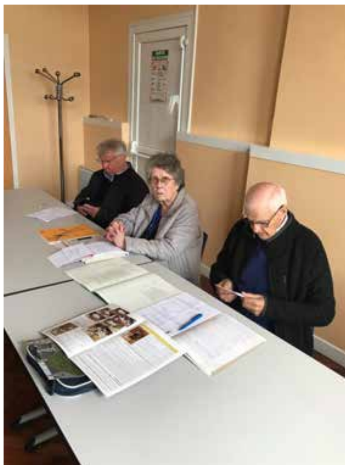
3 mai 2024. Assemblée générale de l'association ACPGCATMVG de Le Ronssoy – Lempire Le bureau et les Maires.