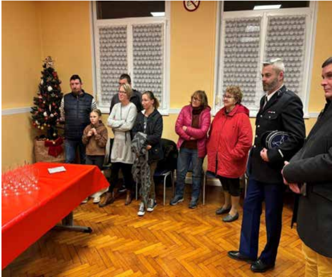
14 janvier 2024. Une partie de l'assistance.