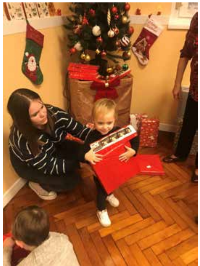
Des enfants heureux de leur cadeau.