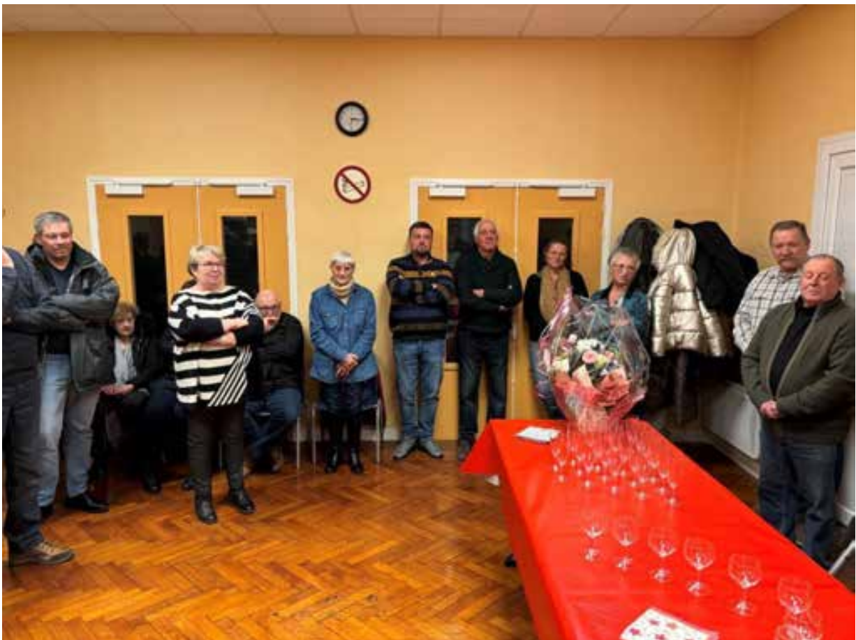
14 janvier 2024. Merci à l'ensemble des présents.