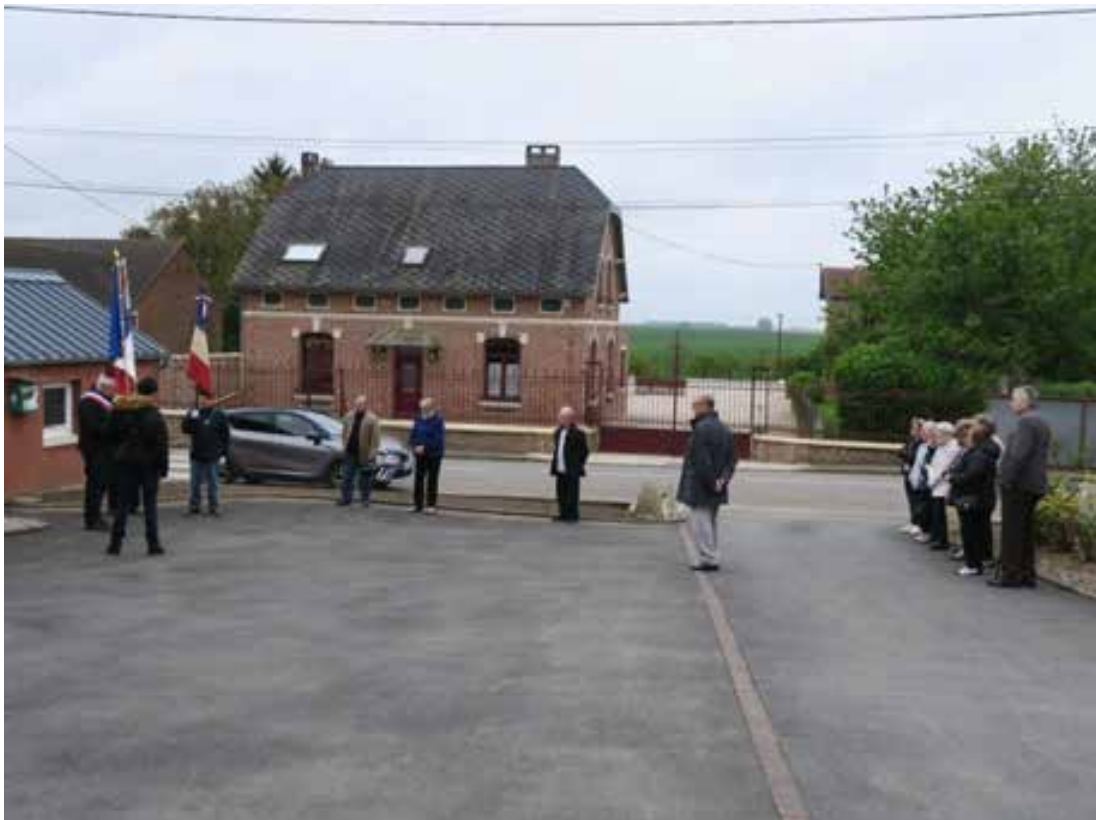
8 mai 2024. Dépôts de gerbes, appel aux Morts de Lempire, sonnerie aux Morts, discours officiel, suivi de La Marseillaise, devant une assistance peu nombreuse mais habituelle.