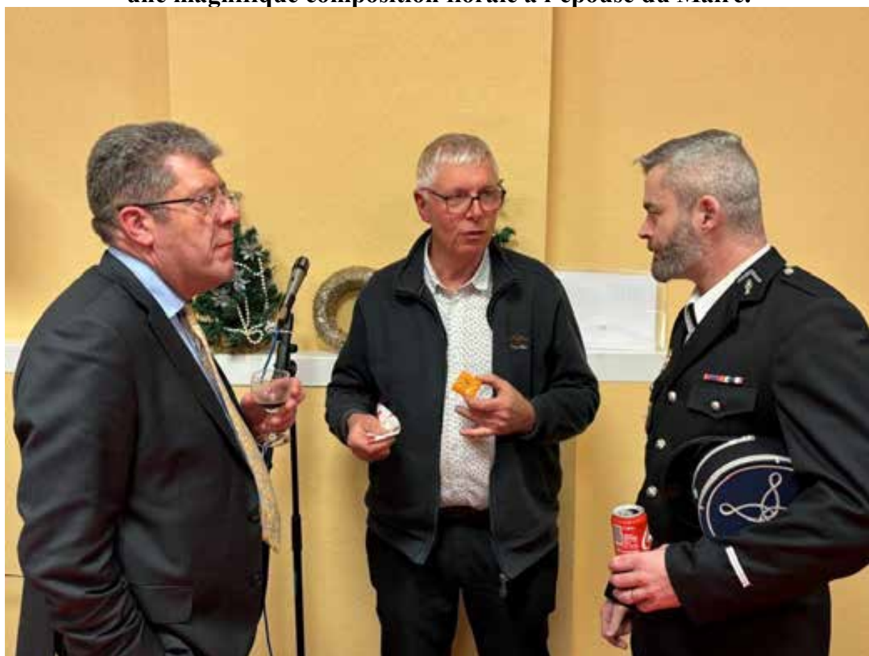
Avant de passer au moment convivial et aux discussions.