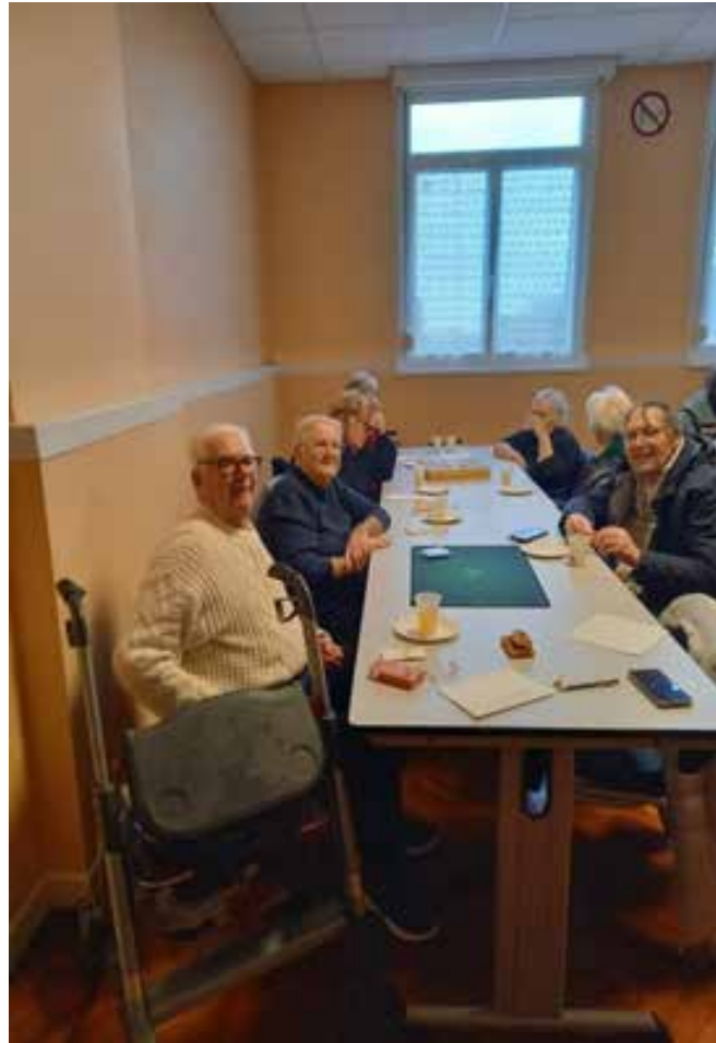
8 février 2024. 1 ère rencontre des bénéficiaires du Sivom. Animation jeux de société.