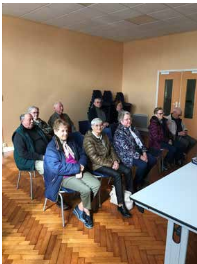
3 mai 2024. L'assistance des adhérents et sympathisants. Dans la salle de la Mairie de Lempire. Préviation du calendrier des manifestations.