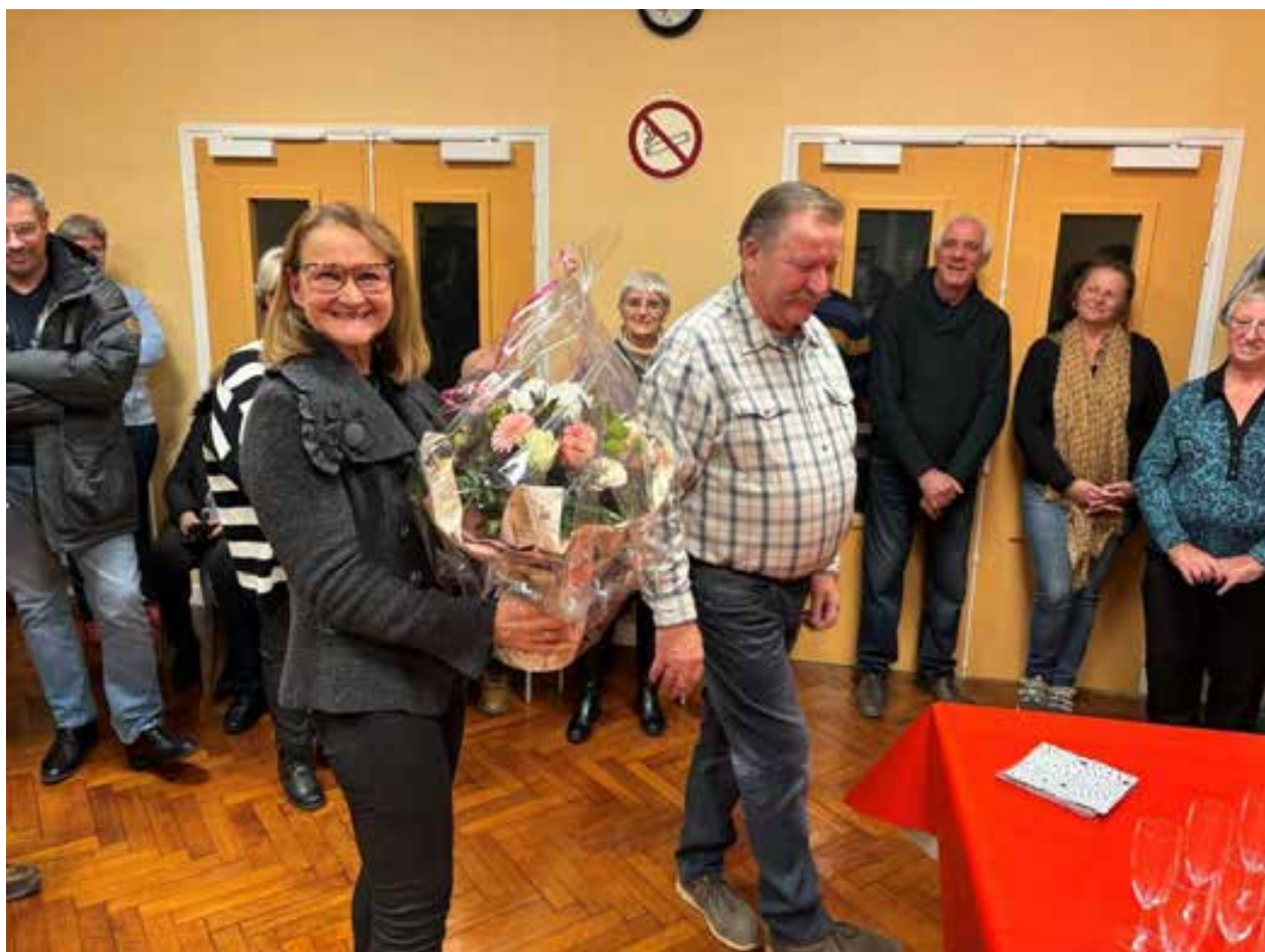
14 janvier 2024. Comme chaque année, les adjoints ont offert une magnifique composition florale à l'épouse du Maire.